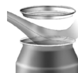
Dispositivo iniezione CO2 CO2 injection device